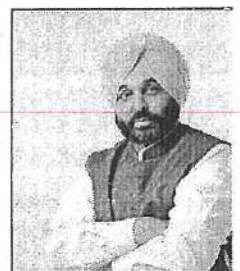
Sh. Bhagwant Mar Chief Minister Punjab

Secretary Bhartiya Vidya Mandir Trust Shaheed Udham Singh Nagar, LUDHIANA.